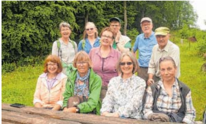
Kleine Rast: Die fröhlichen Wanderer des VVO freuten sich über eine Tour durchs Weserbergland.

Nach der verdienten Stärkung am Familienrastplatz, an dem die aufgestellten Tische und Bänke an eine Waldschule erinnern, liefen die Wanderer weiter und hatten streckenweise weitreichende Blicke auf die im Tal liegenden Orte. Sie passierten den Steinbruch Wülper Egge und liefen von hier in Richtung Kleimbremmen, vorbei am Sportplatz, durch den Ort und dann in Richtung Bückeberg.